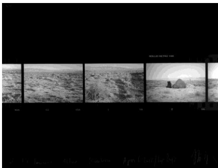
Michael Höpfner, aus der Serie Niederlegen, Aufstehen, Weitergehen. Sanwei nach Altun; Tag 13 , 2012/2017

Sammlung Konstantin Filippou, Wien © Michael Höpfner, courtesy Galleria Michela Rizzo, Venedig; Galerie Hubert Winter, Wien, Bildrecht Wien, 2019