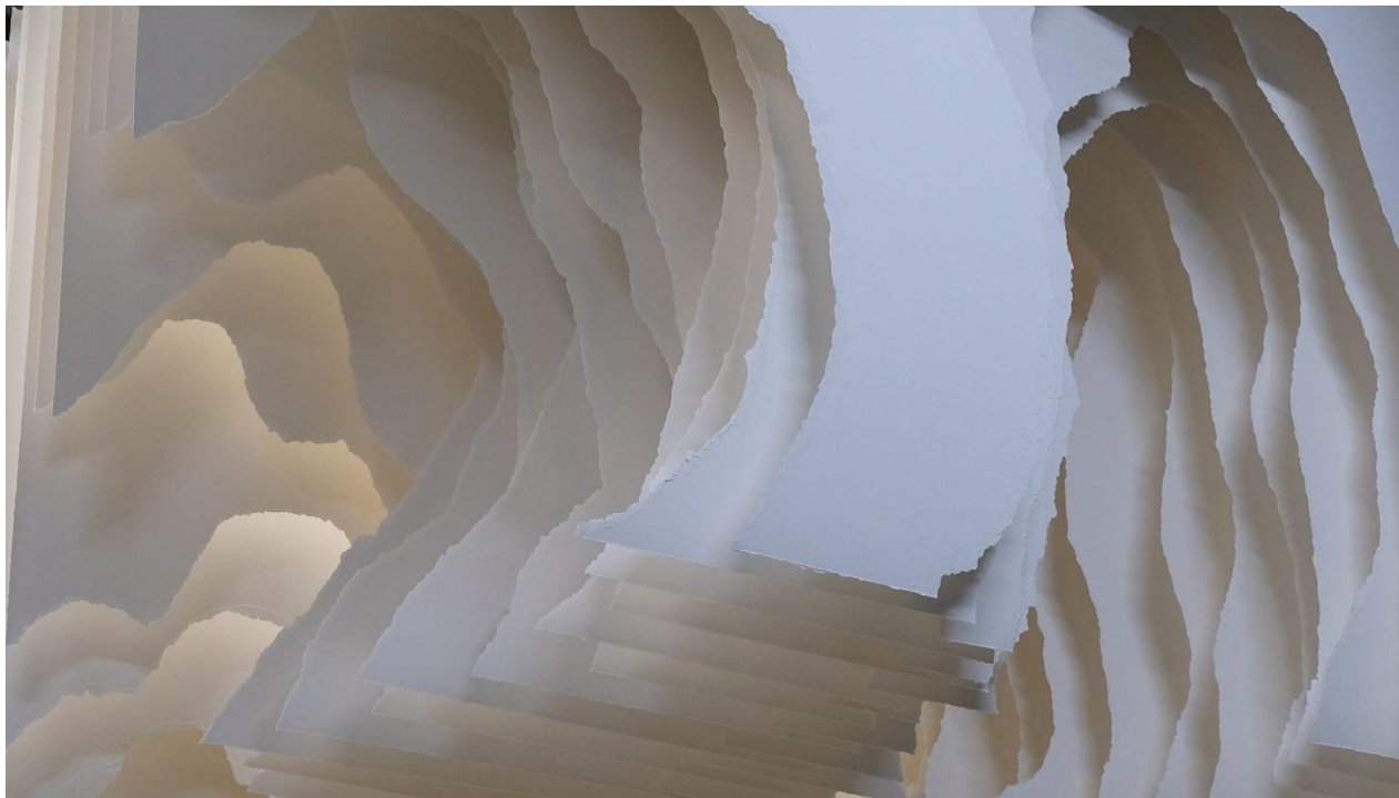
Papierarbeit von Angela Glajcar © Angela Glajcar