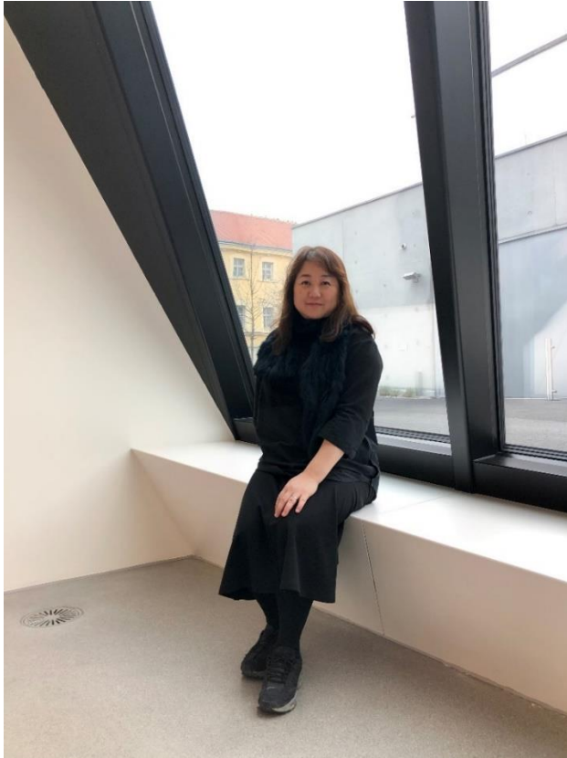
Chiharu Shiota in der Landesgalerie Niederösterreich

Chiharu Shiota wurde 1972 in Osaka geboren, sie lebt und arbeitet in Berlin.