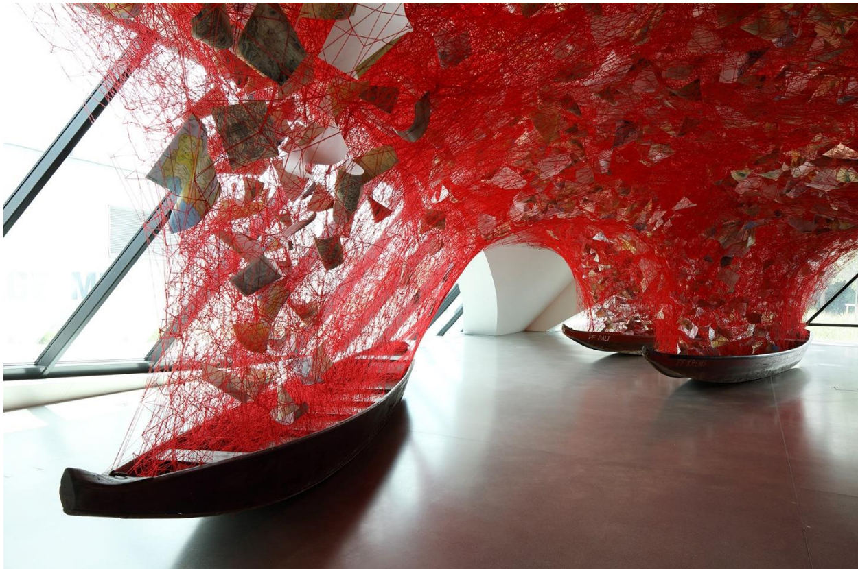
Ausstellungsansicht „Chiharu Shiota. Across the River“, © Chiharu Shiota