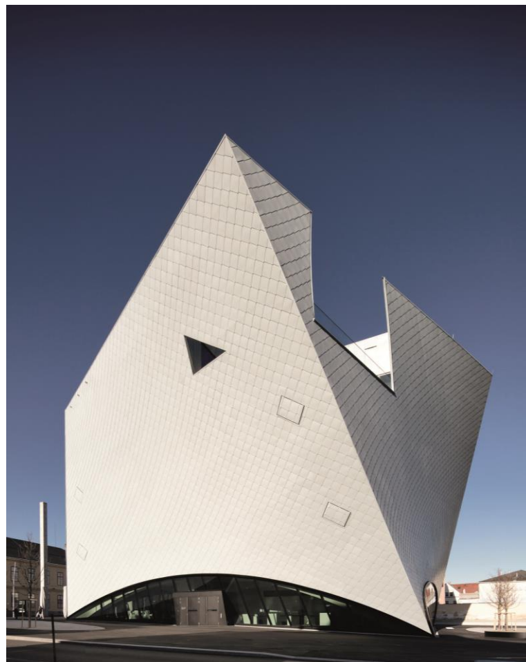
Landesgalerie Niederösterreich, 2019, Foto: Faruk Pinjo

Pressebilder: http://bit.ly/LandesgalerieNiederoesterreich2020